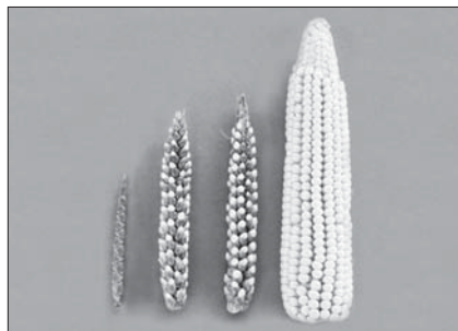
Obrázek 1 Šlechtění kukuřice. Zleva: tráva teosinta, dvě odrůdy kukuřice jihoamerických Indiánů, dnešní kukuřice. Ze srovnání je jasné, kolik genů se muselo změnit během vyšlechtění dnešní kukuřice.

Máme-li si o metodě moderní selekce udělat představu, musíme vzít v potaz její rozměr: přenáší se jeden až tři geny. Člověk má kolem 25 tisíc genů, mšice dvakrát tolik a pšenice takřka 120 tisíc genů. Přenesený gen je jako kapka přidaná do bazény.